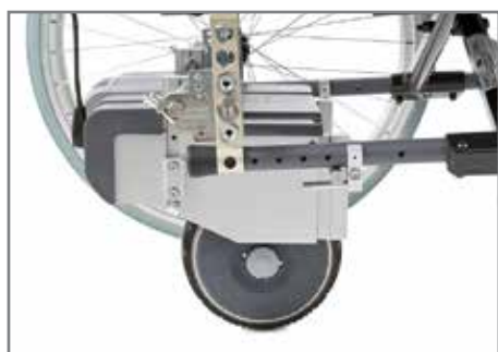
viamobil einfach an die zuvor am Rollstuhl montierte Halterung einhängen.

Einfach. Sicher. Schnell. So funktioniert es: