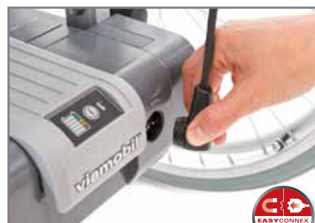
Bediengerät am Akku-Pack einstecken und los geht's!