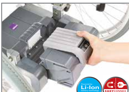
Mit nur einem Griff den Akku-Pack einlegen. Einfach und sicher.