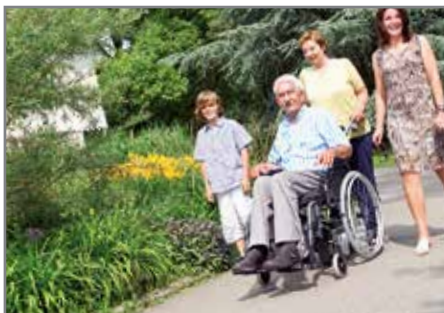
Komfortable Sicherheit auch bei Gefälle.

Wir sorgen für Mobilität. Egal in welcher Lage.