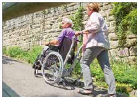
Steigungen ohne jede Anstrengung meistern.