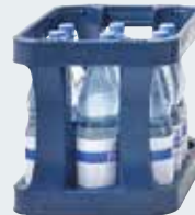
viamobil – klein, leicht, handlich und mühelos zu transportieren